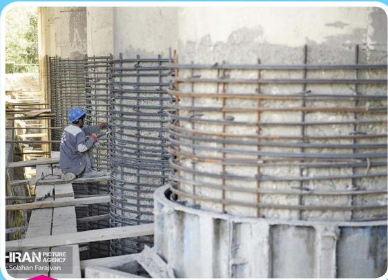
مقاوم‌سازی ۲۴ پل در سطح پایتخت