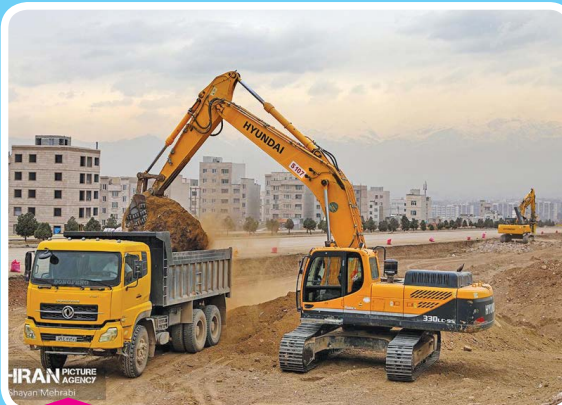
کلان‌پروژه توسعه آزادراه شهید شوشتری در شرق تهران