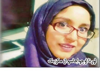
فینا تارو، نویسنده از آلمان