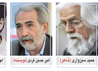
حمید سبزواری (شاعر)